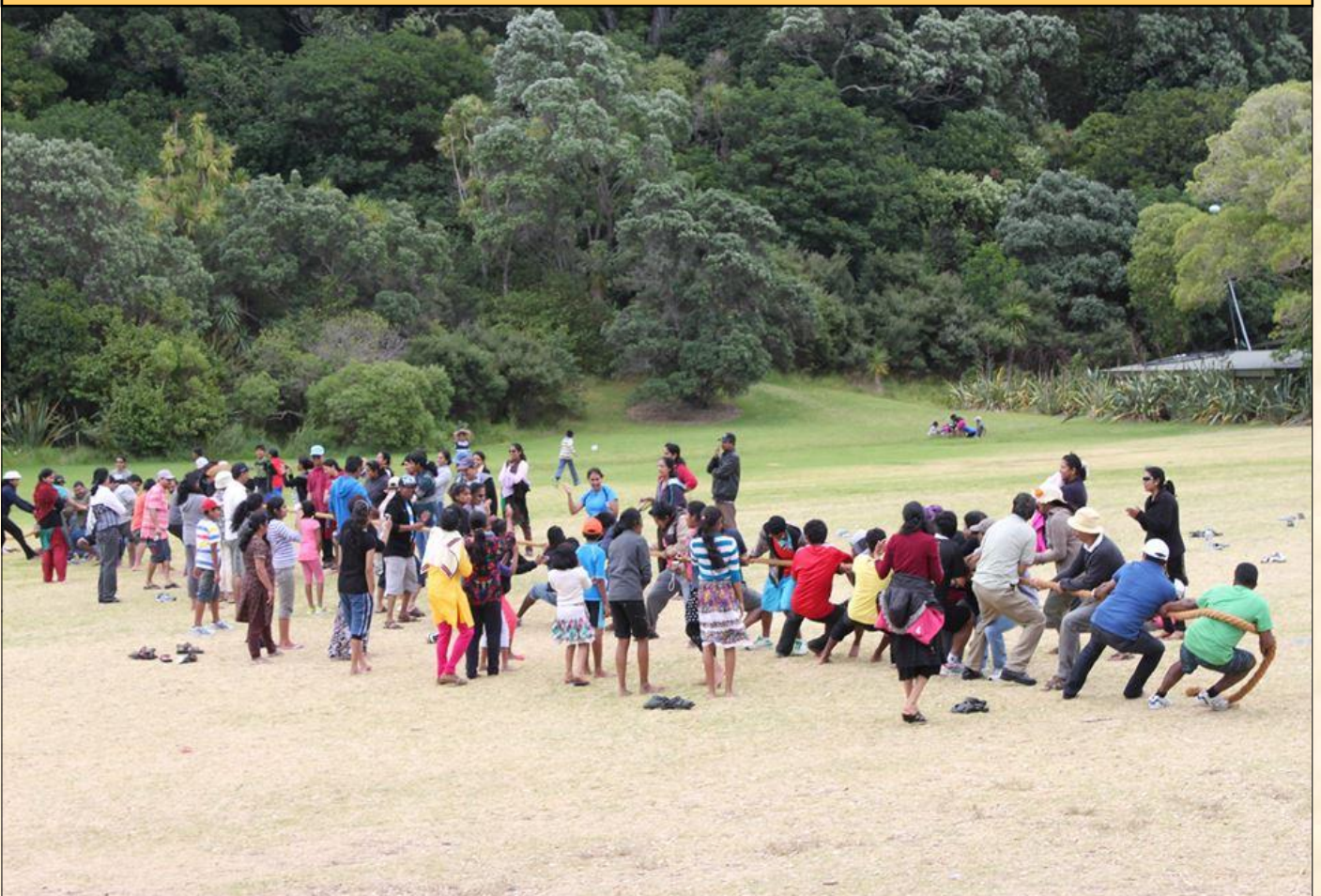
Parishioners enjoying the annual picnic conducted by the parish