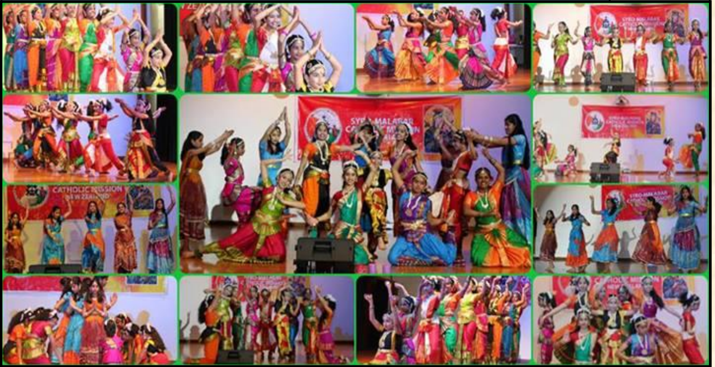
Cultural Activities held as part of the Parish Feast Celebrations, 2013