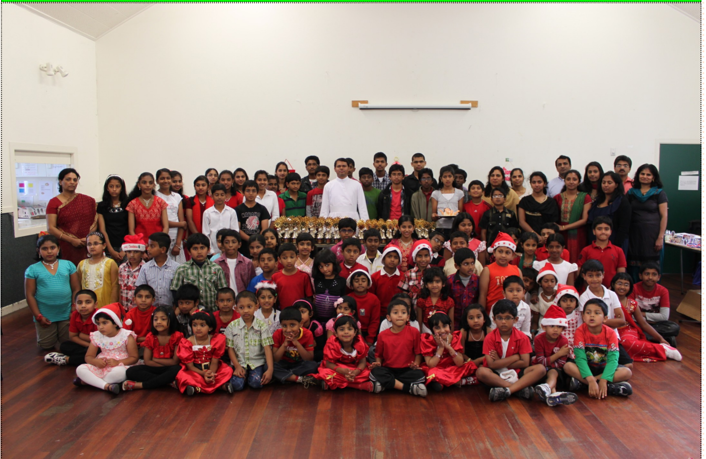
Sunday School Christmas Celebrations and Award Function 2011